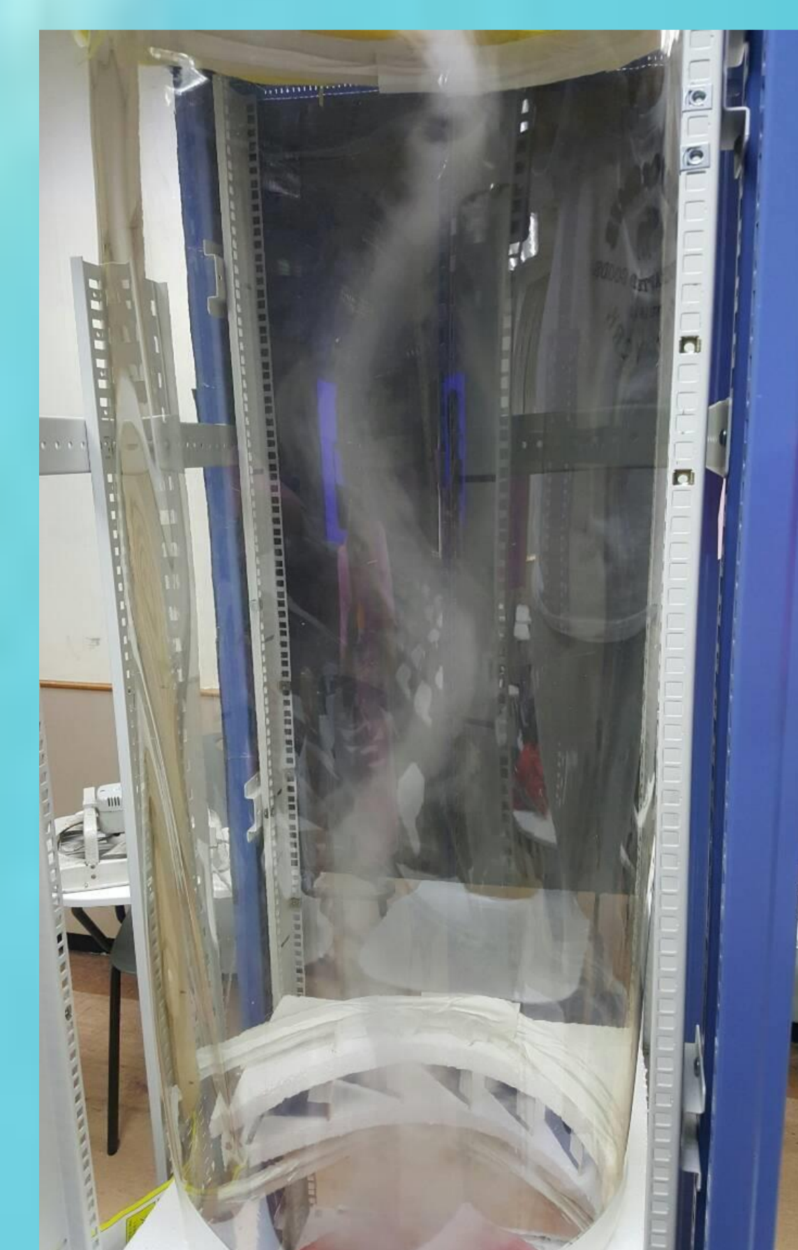
抽風扇在旁邊，導風扇開口較大

參考單位或資料：國立台灣大學大氣科學系動力研究室 http://typhoon.as.ntu.edu.tw/