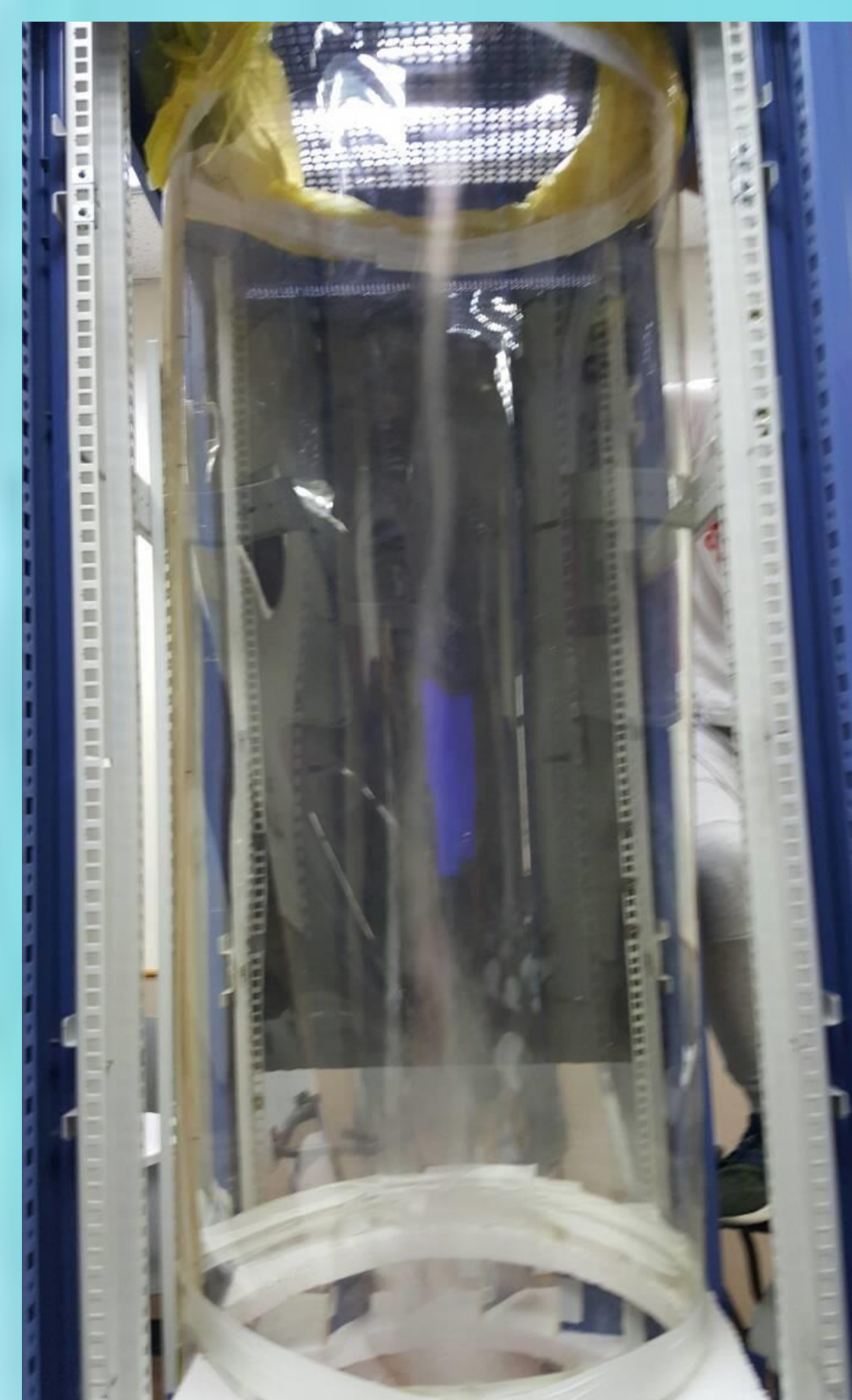
抽風扇在正上方，導風扇開口較小